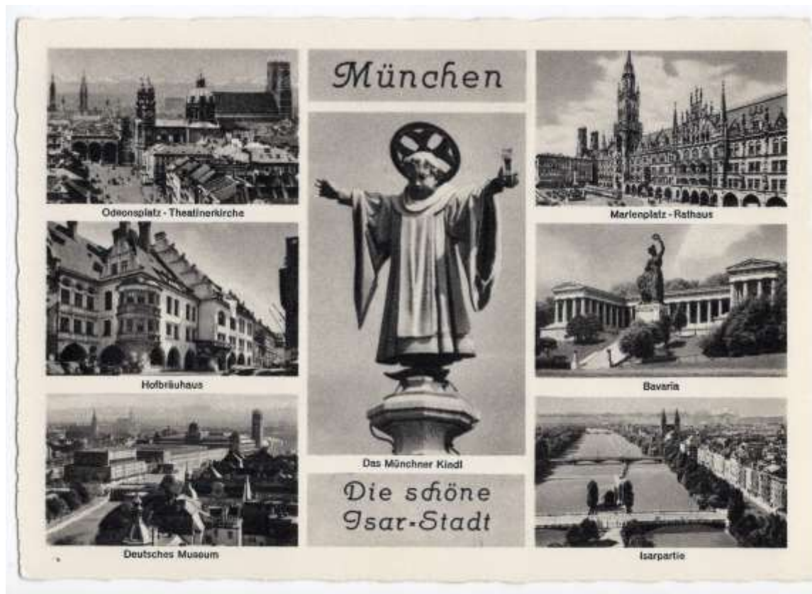
Vorderseite der Karte

Münchner Bildkunst-Verlag August Lengauer, München 19